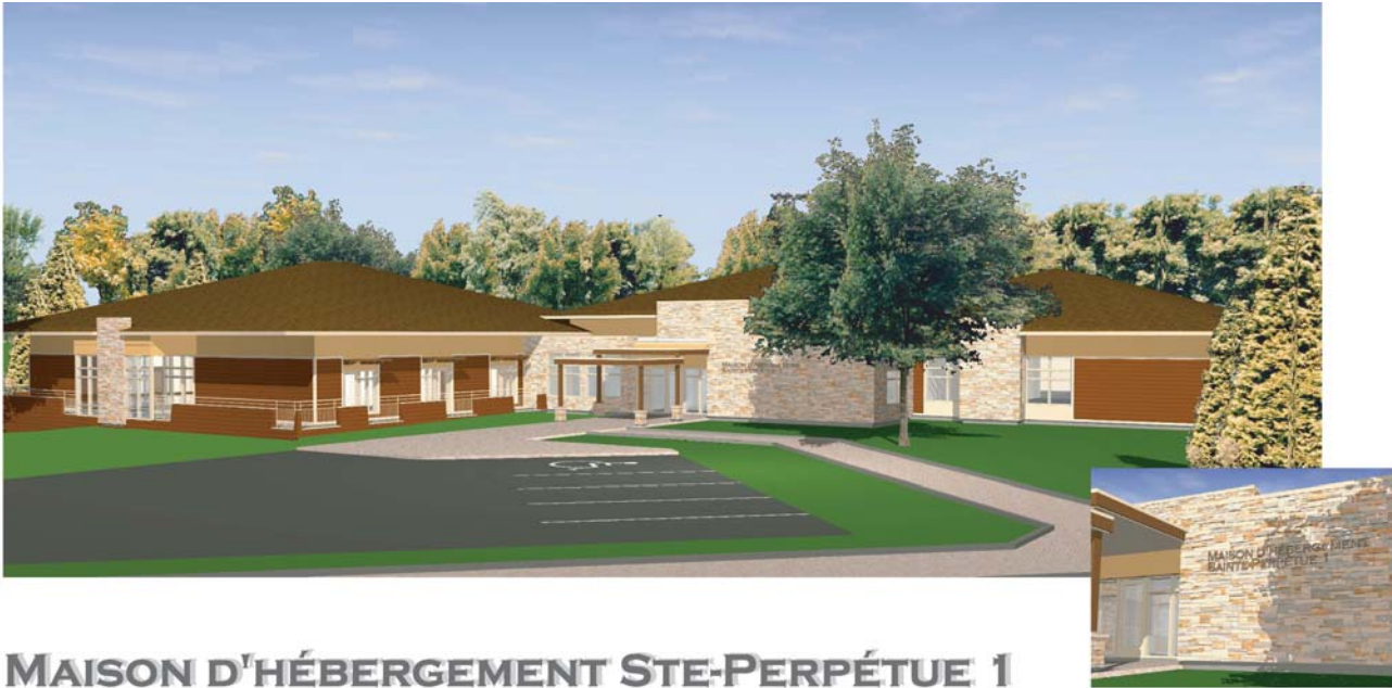
MAISON D'HÉBERGEMENT STE-PERPÉTUE 1