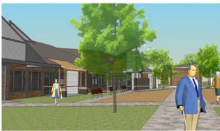
MAISON D'HÉBERGEMENT ST-EUGÈNE BÂTIMENT 2